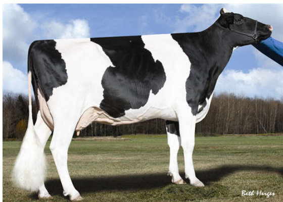
MORNINGVIEW GOLDWYN LENA THIRD DAM