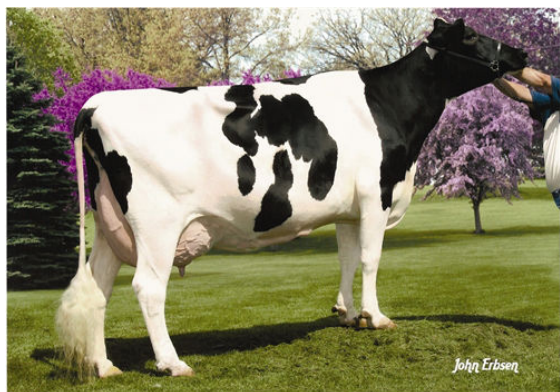
MURANDA BWM LORETTE FOURTH DAM